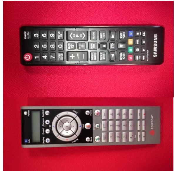
Polycom videokaamera pult

Kui vajutada videokaamera puldil „POWER“ nuppu, ilmub selline pilt ekraanile