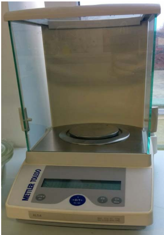
Joonis 2. Analüütiline kaal.

Illustreerivat materjali (joonis, tabel, tsitaat vm) ei esitata ilma vahepealse tekstita järjest.